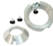
LKW-Konus Ø 110 – 190 mm + Distanzring