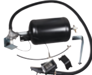
IT Lufttank Kit