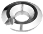
LKW-Konus Ø 75 – 145 mm