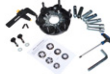
Kit mit Schwenkbolzenflansch für geschlossene Felgen