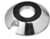
Konus Ø 75 – 120 mm für Stahlfelgen